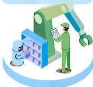
工作機械や ロボットの導入