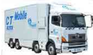
●16列マルチヘリカルCT搭載車