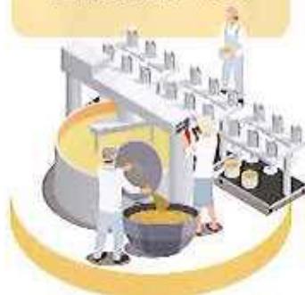
自動調理器の導入